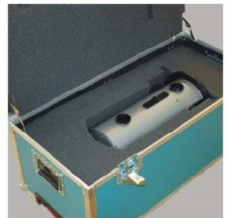
Flight-Case mit Scanner