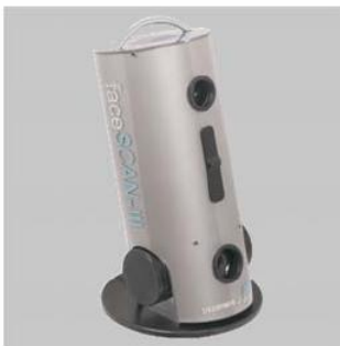
faceSCAN-III, neues Design