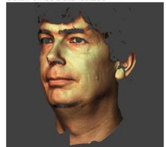
Gesichts-Scan mit Farbe

Breuckmann GmbH Industrielle Bildverarbeitung und Automation Torenstr.14 · 88709 Meersburg Tel: +49 (0) 75 32 - 43 46 0 Fax: +49 (0) 75 32 - 43 46 50 info@breuckmann.com www.breuckmann.com